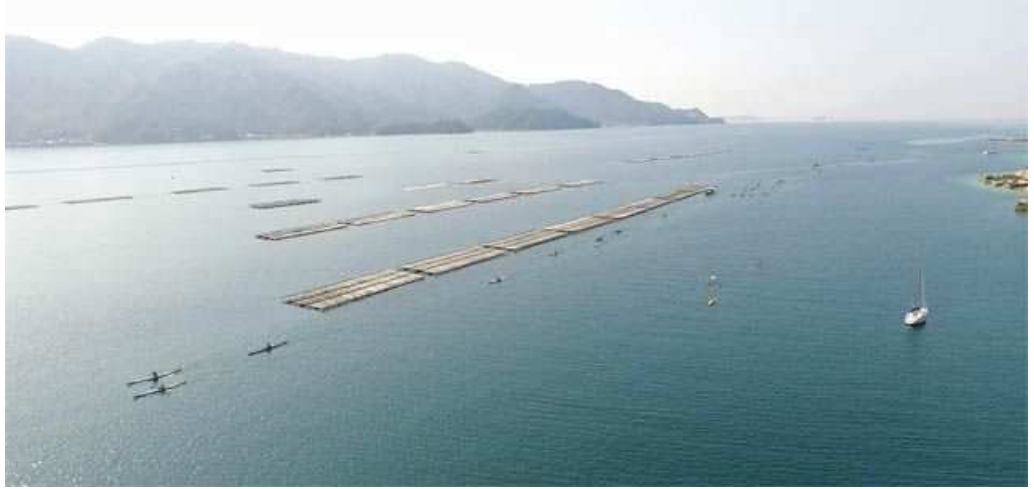
おだやかな気候となった大会当日の海

平成30年3月11日（日）ビーチ長浜にて2018広島カヌー第15回長距離選手権大会が開催されました。冬型が緩んで風もなく過去最高の小春日和と思える絶好のコンディションとなりました。最高気温は13度、南西の風1-2m。波はほとんどたたず、最高のカヌーレース日和に参加者も海と風を満喫していました。