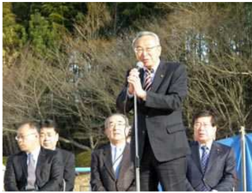
明岳周作江田島市長による御挨拶