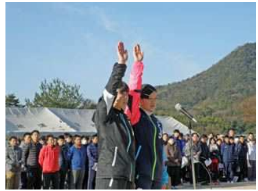
選手宣誓は双子姉妹