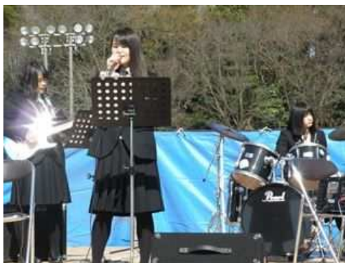
大柿高校軽音楽部による演奏