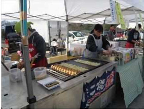
ずらっと並んだ、たこやきがおいしそうです。