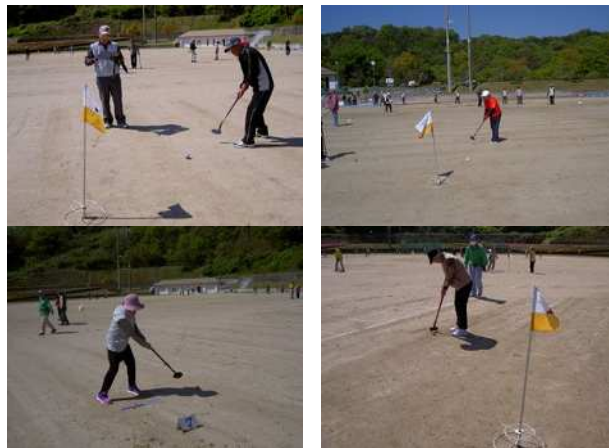
各グループで熱戦が繰り広げられました

今年は市内合わせて参加者は92名と例年のごとく盛大な大会となりました。競技自体も手際よく行われ、3コース24ホールの競技を楽しめました。成績は今年はふるたか・大柿・ふるたかが1位2位3位となりました。表彰のあと、最後はおたのしみ会としてくじ引きもおこなわれ、みなさんの元に米や酒、食用油・石鹸など生活用品が配布されました。