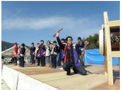
地元柿浦盆祭クラブによる神楽。太鼓の太い低音の音色が腹にこたえます。