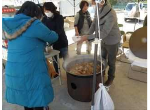
大柿高校PTAのおでん、安いです。