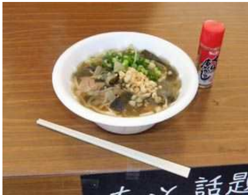
地元の迫製麺の釜揚げうどん。広島のうどんにしては昆布やイカ揚げの利いた濃い出汁でかなり食べ応えがあります。お昼時には行列ができるうどん屋さんでした。