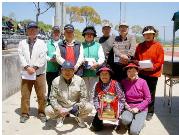
手前上位入賞者3名と10位までの表彰者 記念写真