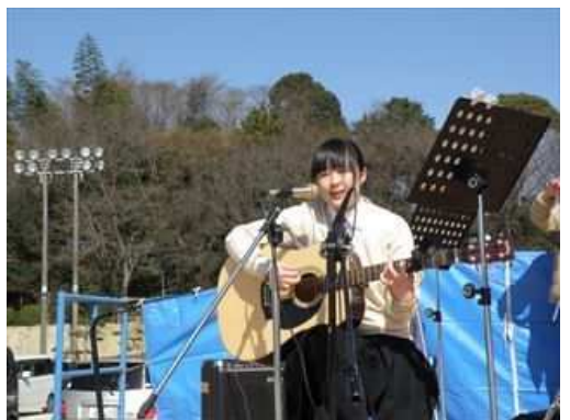
同じく大柿高校生徒のギター