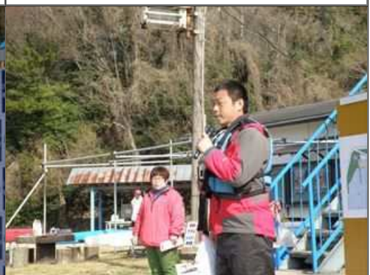
沖審判長の競技前注意