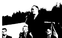
沖井実行委員会委員ごあいさつ