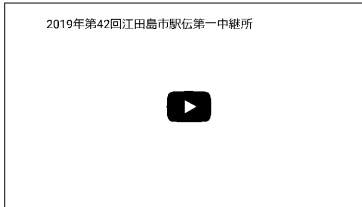
江田島市駅伝第一中継所の様子