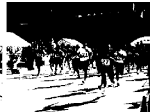
2019年の江田島市駅伝スタート