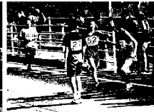
第一中継所でたすきをつなく2