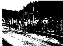
第一中継所でたすきをつなく1