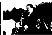
平口衆議院議員ごあいさつ