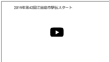
江田島市駅伝スタートの様子