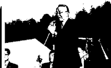
朝島市長ごあいさつ