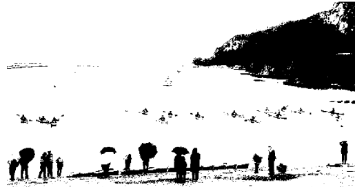
あいにくの小雨の天候だった大会当日の海